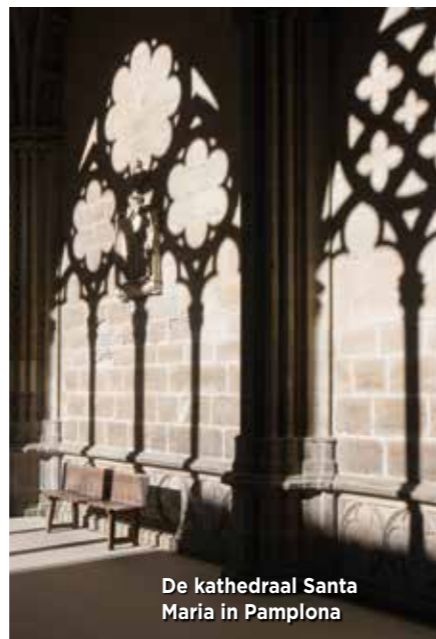
De kathedraal Santa Maria in Pamplona