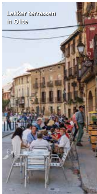
Lekker terrassen in Olite

De bevolking van Navarra telt zo'n 620.000 inwoners, waarvan de helft in de hoofdstad Pamplona en in de grote gemeenten erom heen wonen. Pamplona vormt het beginpunt van onze ontdekkingsreis. De stad staat vooral bekend om de San Fermes (de stierenrennen) dat jaarlijks begin juli duizenden bezoekers trekt. En de pelgrimsroute naar Santiago de Compostella dwars door de stad. De bewoners van deze stad zijn trots op hun van oorsprong oude koninkrijk met een rijke, onafhankelijke geschiedenis. Overal hangen kleurige vlaggen en symbolen aan huizen en balkons.