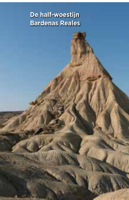
De half-woestijn Bardenas Reales